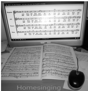
Laptop mit Noten - Kantorei im Homeoffice

Was waren das für urheberrechtlich einfache Zeiten mit analogen Proben, Gottesdiensten und Konzerten! Die Rechtefragen bei Online-Formaten sind eine Wissenschaft für sich – und allen, die mal eben schnell eine Aufnahme ins Netz stellen wollen, sei dringend zur Vorsicht geraten! Die EKD hat eine hilfreiche Webseite erstellt, die umfassend über die drei Aspekte Verwendung von Noten und Liedtexten, Musikwiedergabe und Leistungsschutzrechte informiert.